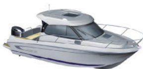
Boote / Nautik